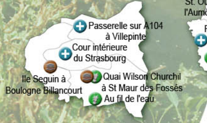
Zoom région Ile-de-France 1ère et 2ème couronne