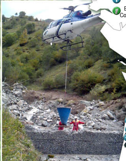
Torrent de l'Yse (65)