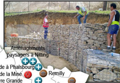
Aménagements paysagers à Nitting