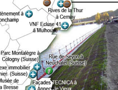
Station épuration de Madroz