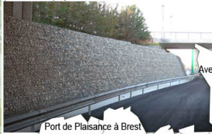
Port de Plaisance à Brest (remplissage vrac)