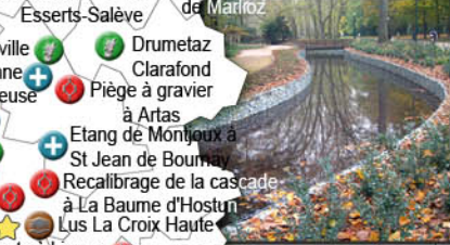
Parc de la Tête d'Or (69)