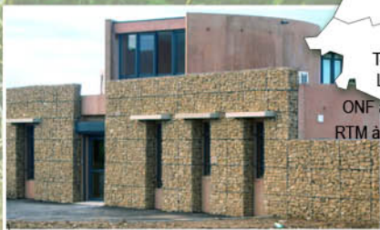
Façades à Bagnols sur Cèze (30)